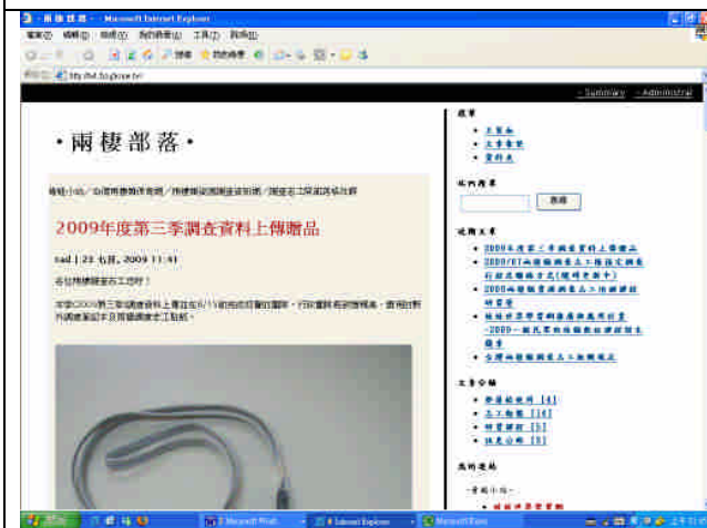
圖 2-3 兩棲部落首頁。