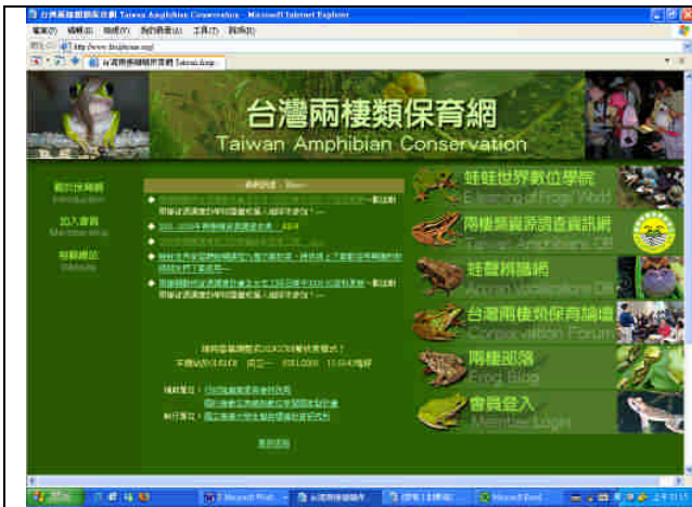
圖 2-1 台灣兩棲類保育網首頁。