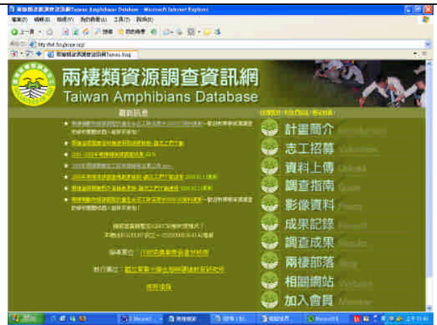
圖 2-2 兩棲類資源調查資訊網首頁。